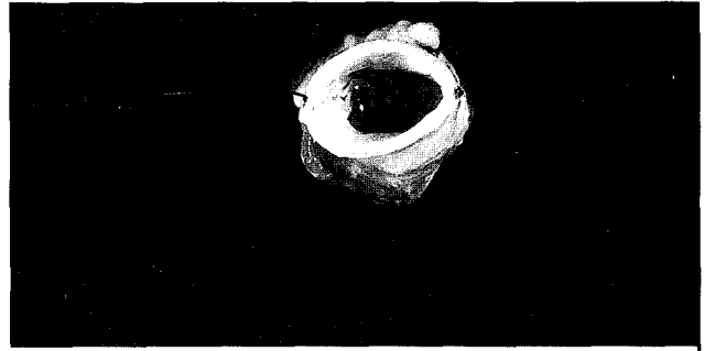
Size-reduced allograft and coaptation of two leaflets

국내 동종이식술의 현황은 구미 각국에 비해 아직 보편화되지 못하고 있는 실정으로 1980년대 후반에 들어서면서부터 소수의 임상 적용사례 및 동물실험결과 등이 발표되기 시작하였다 12-14) . 이러한 배경에는 사체손상을 금기시하는 오랜 사회관습과 뇌사를 사망으로 인정하지 않는 등의 특수한 사정으로 동종이식편의 획득이 어려웠던 점