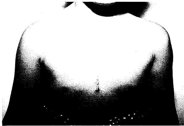
Fig. 3. Postop scar in patient with atrial septal defect

1년개통성에 차이가 없었으며 무재개통율(freedom from revascularization rate)은 전자에서 현저히 높았던 것을 보고하면서 초기 학습곡선상의 자료를 제외하면 중장기 개통율 역시 전자에서 양호할 수 있다는 사실을 시사하였다. 본 증례들의 경우에서도, 비록 단기간의 선택된 환자에 대한 시도였지만, 수술사망 및 합병증없이 비교적 안전하게 재연할수 있는 수술접근이었다는 사실을 입증할 수 있었다.