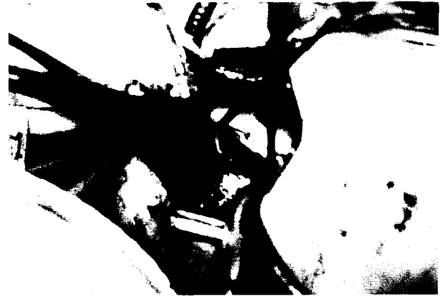
Fig. 2. Surgical view

현재의 보편적인 개심술방법은 정중흉골절개, 심폐우회술, 심근보호로 요약될 수 있다. 전(全: full) 정중흉골절개는 심장판막, 관상동맥을 포함한 모든 심장내외부 및 주변 구조물의 동시접근을 가능케 하는데, 이는 충분한 시야확보와 안전성이 심장수술의 가장 중요한 요소들이란 점을 감안할 때 목적에 잘 부합되는 수술원칙이라 할 수 있다. 특히 재수술이나 복잡심기형 교정 등 수술이 복잡해 질수록 상기 원칙은 필수적이라 할 수 있다. 최근들어 덜 침투적인 수술의 개념이 외과의들 사이에 관심의 대상이 되기 시작하면서 복강내시경 또는 흉강경 등을 이용한 수술방법과 수술기구의 발전에 힘입어 시도되기 시작한 소위 최소침투적심장수술(minimally invasive cardiac surgery)이 외과적인 외상(surgical